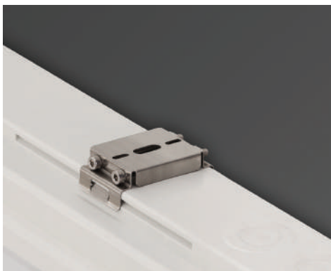
Montaža na zid ili strop