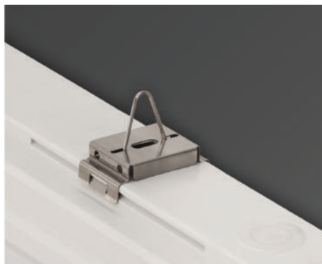
Montaža kao viseće tijelo